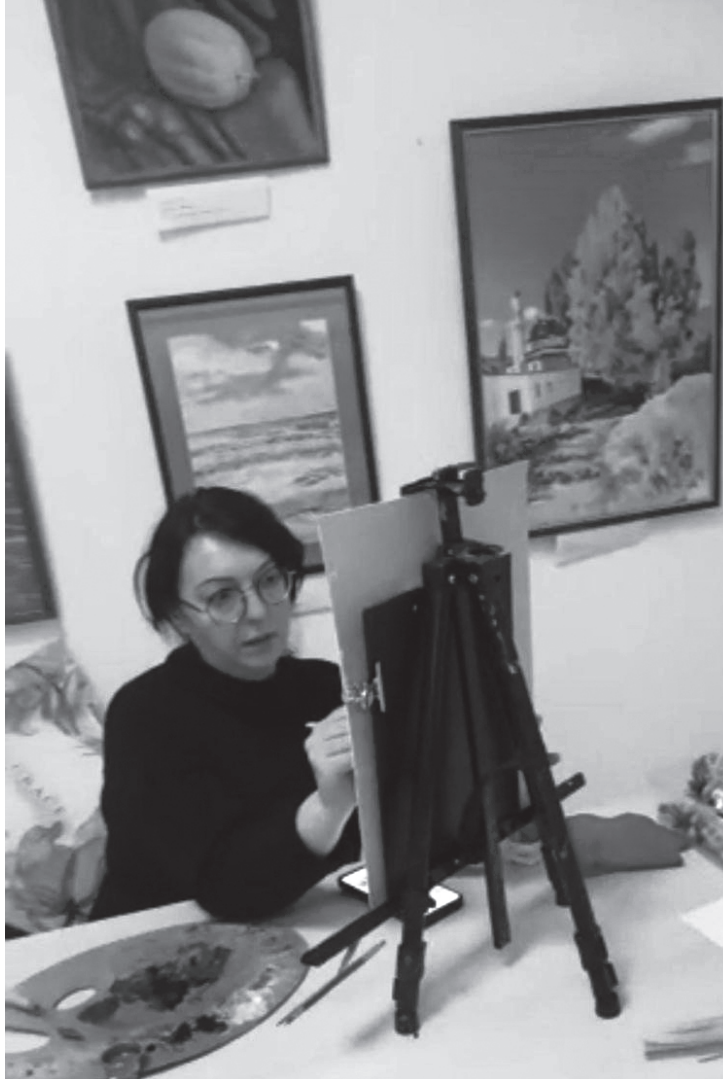
Илдала бегьтала ургаб Лейлани халаси хурмат сархиб. Лейла Кьадиевна «ДР-ла ба-

Малхиямси, жавабкардеш-личил рурси Лейлани сунени кадрихьубти дурсри бунчантзиси гьяхил аргахьес, илдачи диги ва багьуди имцIадихьес хала-