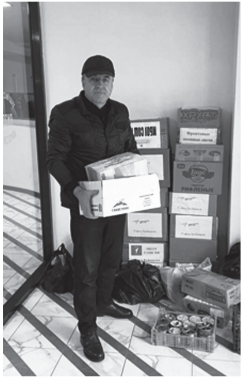
Лавашала районни жигарчебли гьаббуручи саби дявила хасси балбуцлизир бутлакьандеш дирути.

Гьаннара района цахнабси багьудила учреждениебала мугьаллимтани хьядурдарибти хандакьуназир пайдаладирути шямани цаладяхили хасте пунктаназе даахьиб.