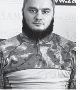
Агьула чиччалара Балулра гьандикичи.

Ватан балтахьантала Кьанназив гьахькьана, Мьямаулла гьахьгьабза, Сайри хьу шила багьа.