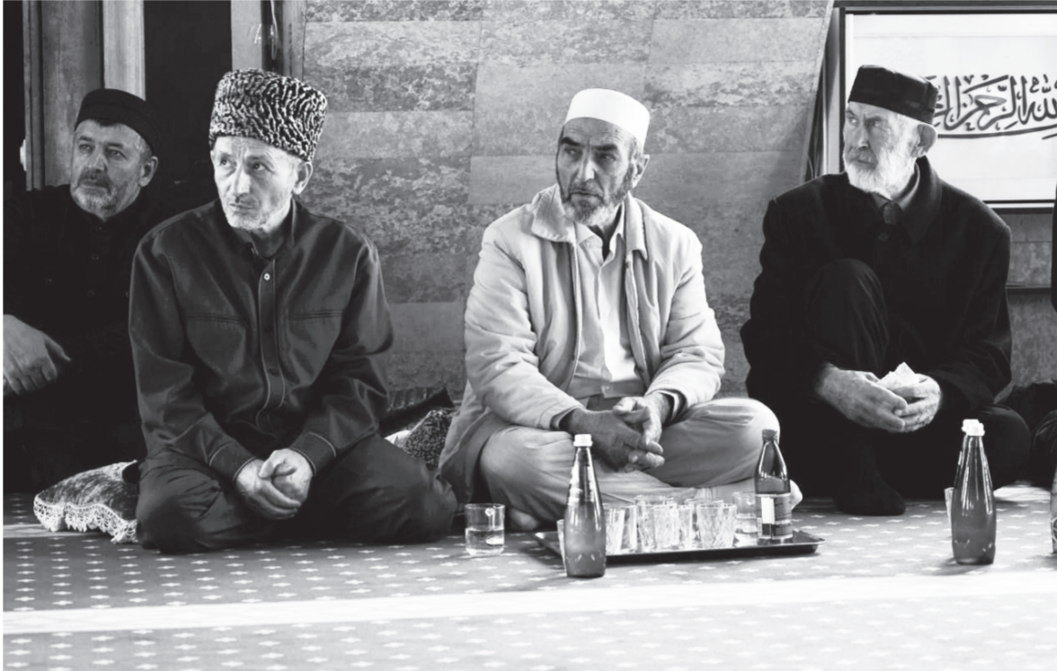
ракат калахъес багъандан.

Февраль 10-личи Ахъушала шилизбис Хала мижитлизиб республикала къадрила динна му-гъялиментала мажлиси бетерхур. Ил мажлис динна шайчибси халаси мягнала балбуц сабри. Ил-изир бутлукъандеш дариб ДР-ла муфтй шайх Пяхъямд Апандини, Ахъушала районна Хала мижитла имам Пябдуллагъ-Хъажи-маргучевли, ДР-ла динна-гилмула гъялиментани, Ахъушала районна мижитунала будунтани ва цархилтирра районтала жамигъяла вакилтани. Мажлисичира Аллагъла гъайли сабси, Къуръа гъунчибад адамти чебхлебулкъахъес, бусурман динни марли калахъес, нушала Мяхъяммад Идбагла (с.г.в.) уммат мяхкъамбарес багъандани дахъл гъякуму дуриб ва мажлисла бутлукъанчибани тулкира белчун. Барил хъалибарлизиб балгундеш биахъес багъандан, гъяхцад къайгъли дакулударес чарагарси саби, чеалкъуси наслули гъяхлиси бяркъ бедес, илди жавабардешли-чил хлерибахъес, бегтала, халатала хлурматбирутили халабахъес или буриб мажлисличи цабикибтири. Халаси балга бариб Россияла пачалихълизиб ва нушала Дагы-стайзиб даршудеш, балгундеш, ба-